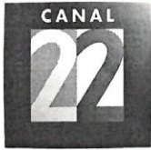
Imagen Corporativa , conforme a los términos del contrato, y de acuerdo con lo establecido en el artículo 51 de la Ley de Adquisiciones, Arrendamientos y Servicios del Sector Público, siempre y cuando la documentación se encuentre correcta.

En caso contrario, CANAL 22 a través de la Directora de Imagen Corporativa , en un plazo de 3 (tres) días hábiles notificará a EL PROVEEDOR y le devolverá la factura con el objeto de que realice la corrección y reinicie el trámite, de conformidad con lo establecido en los artículos 89 y 90 del Reglamento de la Ley de Adquisiciones, Arrendamientos y Servicios del Sector Público.