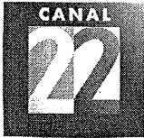
Imagen Corporativa de CANAL 22, y después de la presentación y trámite de la factura correspondiente.